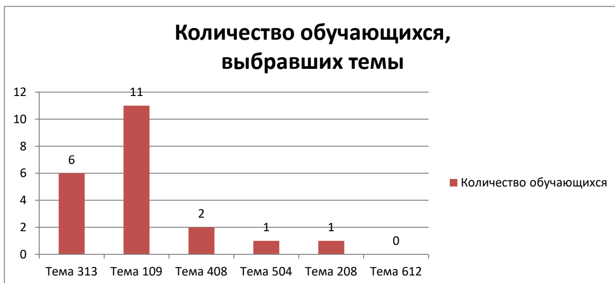
Диаграмма 2. Выбор тем итогового сочинения выпускниками 11-х классов